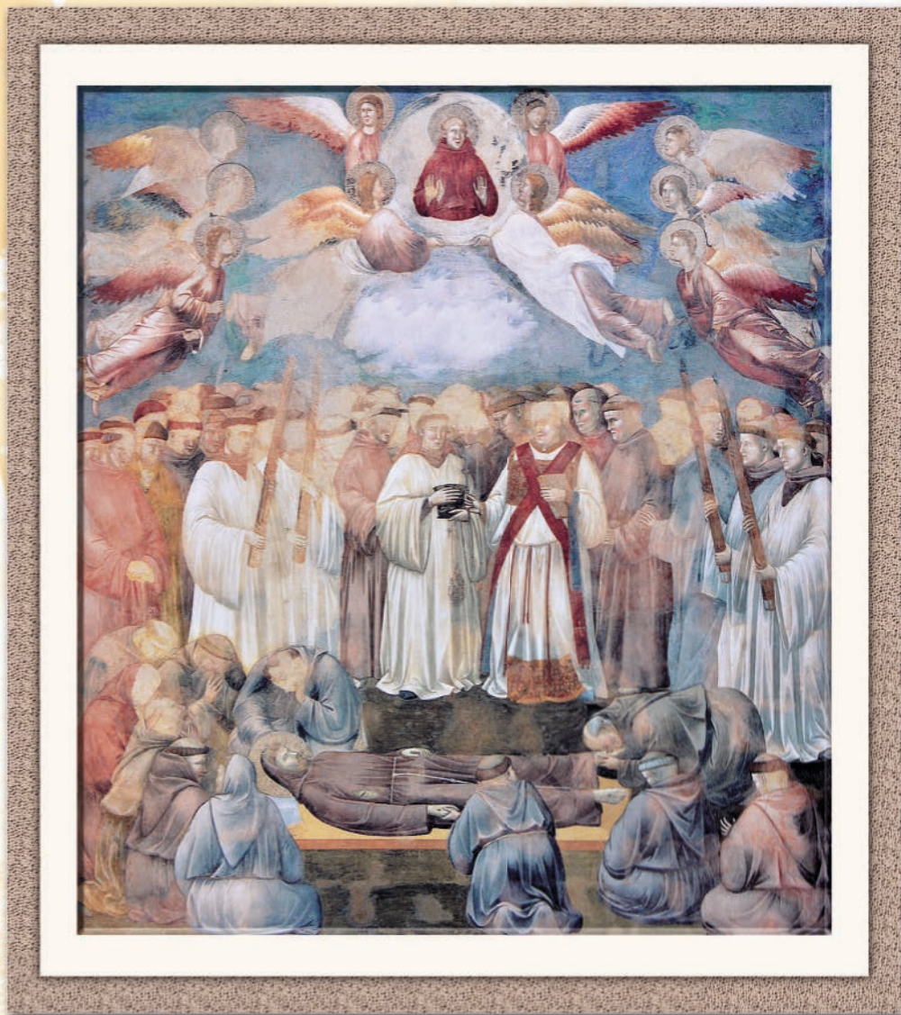
Morte di San Francesco, Giotto, 1295-1299, Basilica superiore di Assisi

Anche oggi Pasqua significa passaggio: dalla paura alla fiducia, dal silenzio del sepolcro all'annuncio che cambia e trasforma: Cristo è risorto.