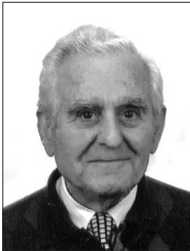
2017 2023 29 novembre