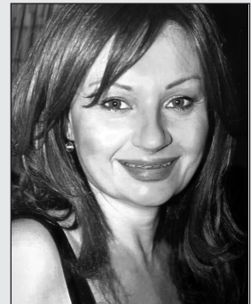
2019 2023 20 gennaio