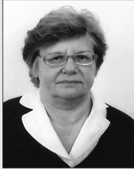
2014 2023 28 ottobre