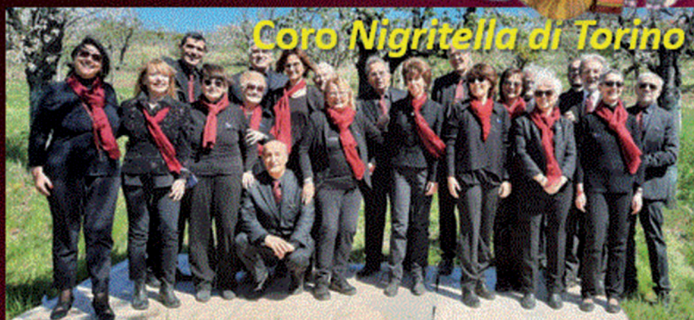
Coro Nigritella di Torino

Parrocchia San Martino Vescovo Sala della Comunità Giovanni Paolo II Via Roma, 7 - Bruino (TO)