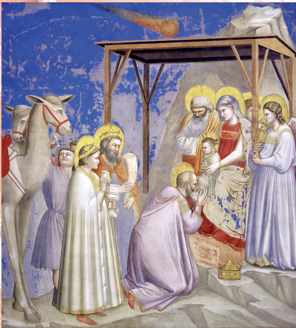
Giotto: ADORAZIONE DEI MAGI - 1303/1305 affresco - Cappella degli Scrovegni - Padova