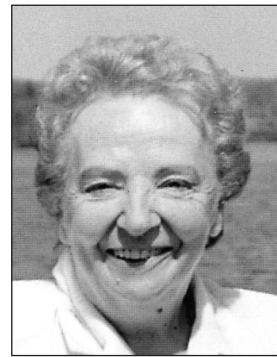
2013 2023 28 giugno

Grazie per aver condiviso con noi parte del Tuo viaggio. La Tua famiglia a ricordo.