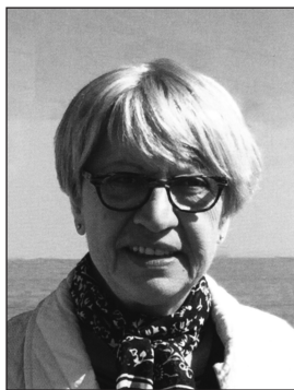
2017 2023 21 dicembre

Il tempo passa ma il ricordo è sempre vivo nei nostri cuori. I Tuoi cari.