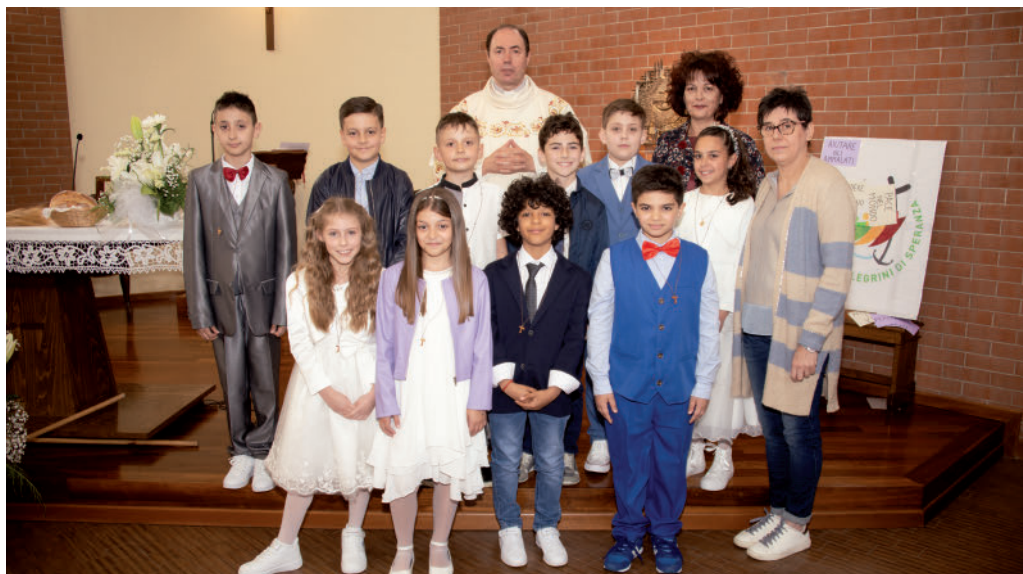
Chiesa Santa Maria Goretti: il gruppo della Prima Comunione del 11 maggio 2025 alle ore 15,00