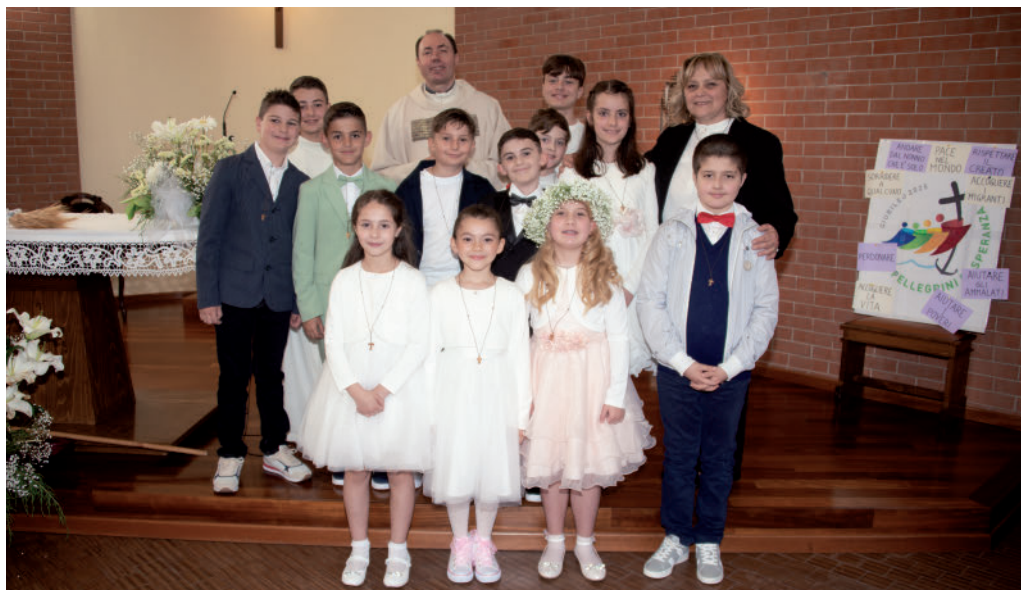
Chiesa Santa Maria Goretti: il gruppo della Prima Comunione del 18 maggio 2025 alle ore 15,00