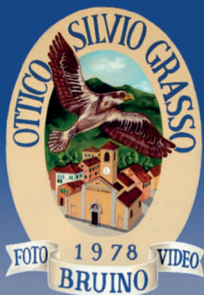
FOTO OTTICA Silvio Grasso