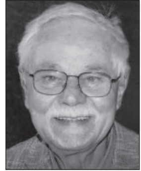
2020 2025 24 marzo