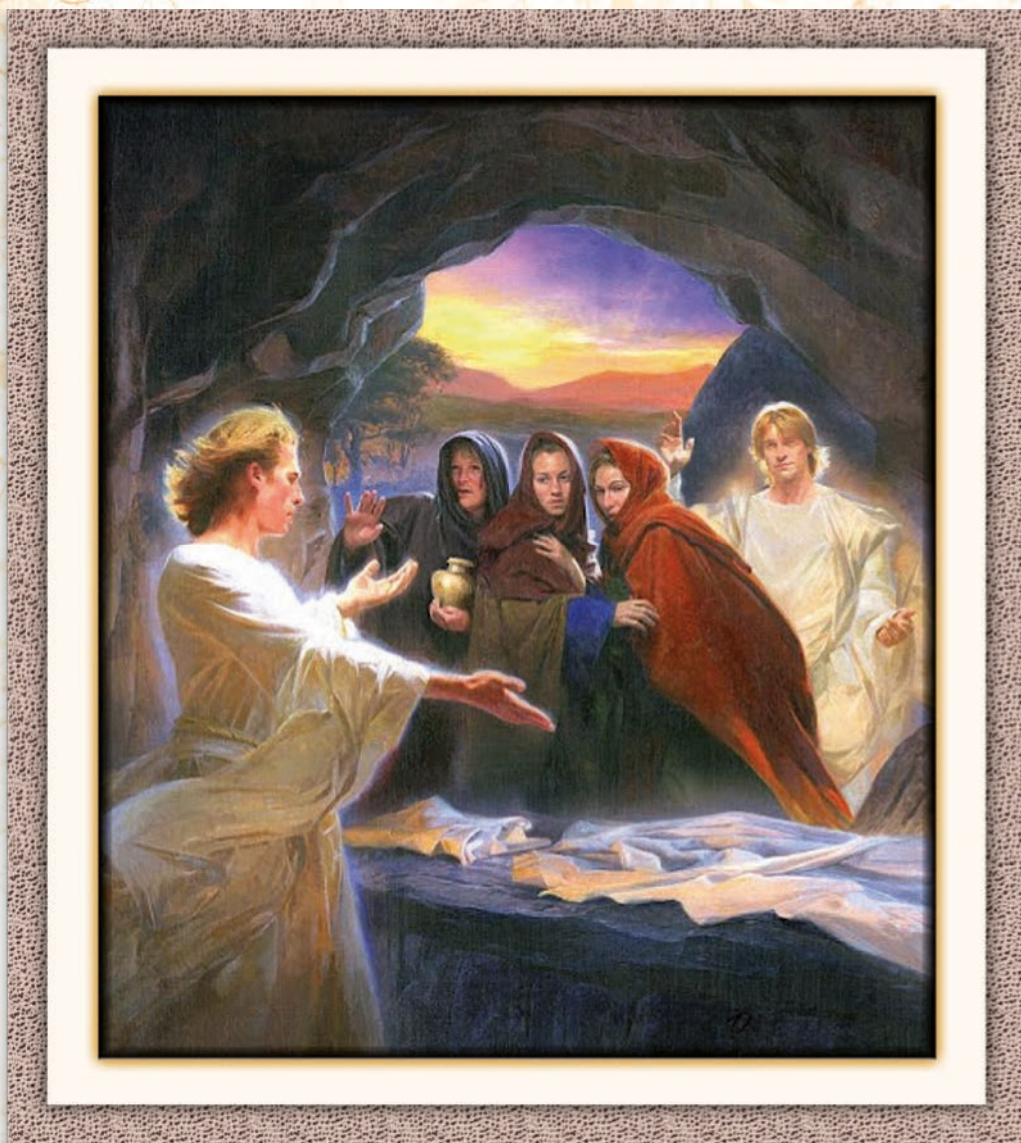
L'incontro degli angeli con le pie donne al sepolcro